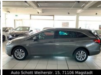
Auto Schott Weierstr. 15, 71106 Magstadt