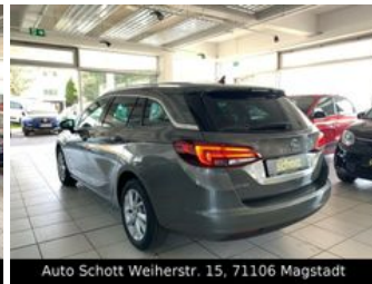
Auto Schott Weiherstr. 15, 71106 Magstadt