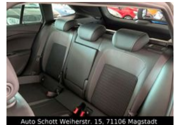
Auto Schott Weierstr. 15, 71106 Magstadt