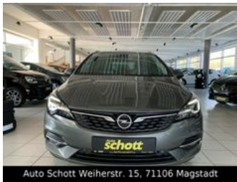
Auto Schott Weiherstr. 15, 71106 Magstadt