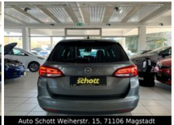
Auto Schott Weierstr. 15, 71106 Magstadt