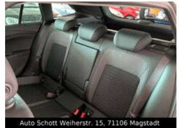
Auto Schott Weiherstr. 15, 71106 Magstadt