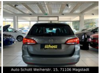
Auto Schott Weiherstr. 15, 71106 Magstadt