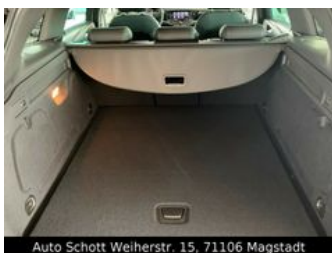
Auto Schott Weierstr. 15, 71106 Magstadt