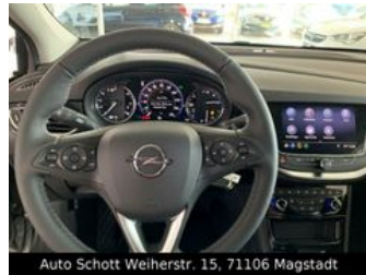
Auto Schott Weiherstr. 15, 71106 Magstadt