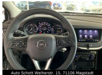
Auto Schott Weierstr. 15, 71106 Magstadt