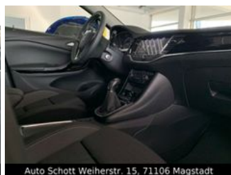
Auto Schott Weierstr. 15, 71106 Magstadt