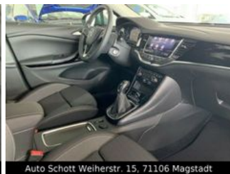
Auto Schott Weiherstr. 15, 71106 Magstadt