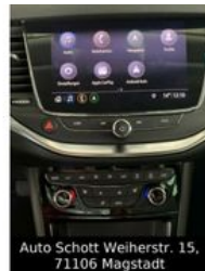
Auto Schott Weierstr. 15, 71106 Magstadt