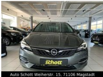
Auto Schott Weierstr. 15, 71106 Magstadt