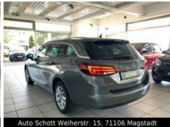
Auto Schott Weierstr. 15, 71106 Magstadt