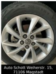
Auto Schott Weierstr. 15, 71106 Magstadt