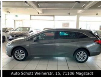
Auto Schott Weiherstr. 15, 71106 Magstadt