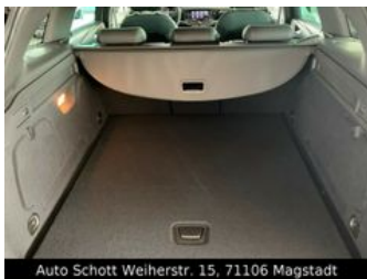
Auto Schott Weiherstr. 15, 71106 Magstadt