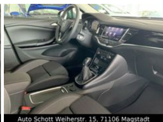
Auto Schott Weierstr. 15, 71106 Magstadt