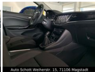
Auto Schott Weiherstr. 15, 71106 Magstadt

* Ehemaliger Neupreis (Unverbindliche Preisempfehlung des Herstellers am Tag der Erstzulassung)